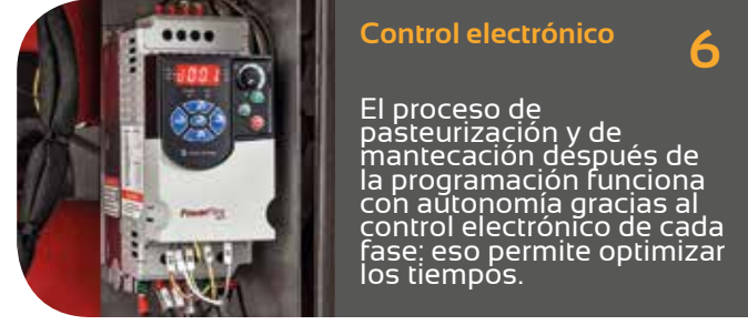
Control electrónico 6

Estructura robusta, totalmente de acero Inox aisi 304 de grande espesor con chasis auto portante pero de dimensiones compactas.