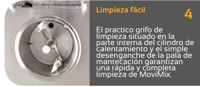
Limpieza fácil 4

La mezcla pasteurizada pasa del cilindro superior al inferior, por medio de un sistema automático de pasaje interno patentado por INNOVA y gestionado electrónicamente, sin intervenciones manuales y posibilidades de contaminación.