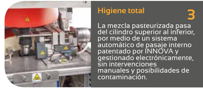
Higiene total 3

Un teclado simple e intuitivo permite una rápida programación de los ciclos de pasteurización y mantecación, utilizando parámetros personalizados.