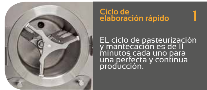
Ciclo de elaboración rápido 1

EL ciclo de pasteurización y mantecación es de 11 minutos cada uno para una perfecta y continua producción.