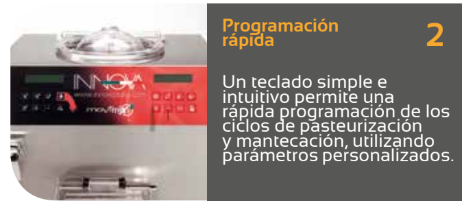
Programación rápida 2

EL ciclo de pasteurización y mantecación es de 11 minutos cada uno para una perfecta y continua producción.